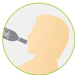
Voie digestive (Ingestion)