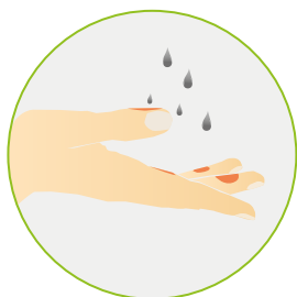
Voie cutanée (Peau)