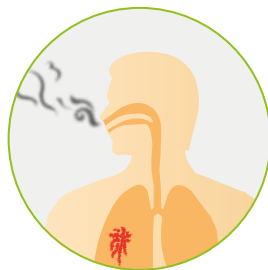
Voies respiratoires (Inhalation)

La pénétration cutanée est bien souvent négligée or la peau n'est pas une barrière infranchissable.